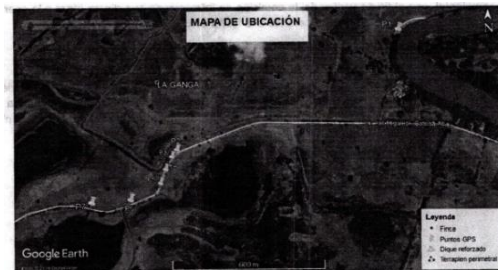
Imagen N°2. Localización de las coordenadas geográficas tomadas en campo y terrapienes identificados.