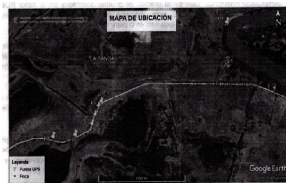
Imagen N°1. Localización de las coordenadas geográficas tomadas en campo.