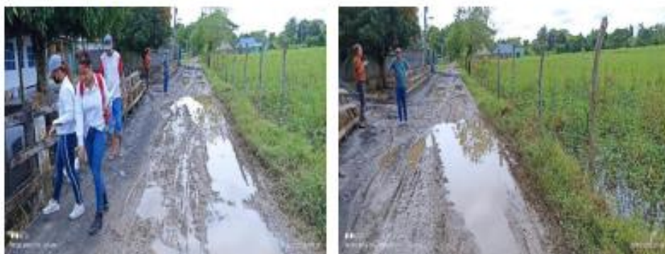
Foto N° 3 y 4. Vía de acceso afectada por la acumulación de agua.