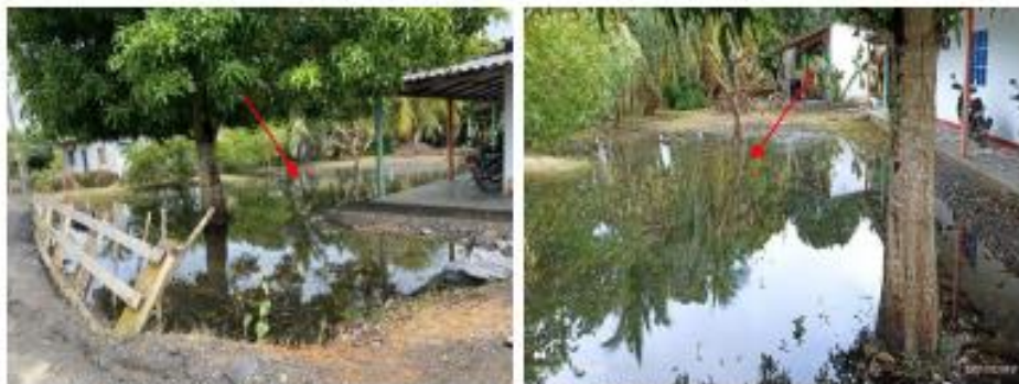
Foto N° 1 y 2. Se evidencia estancamiento y descomposición de aguas alrededor de las viviendas.