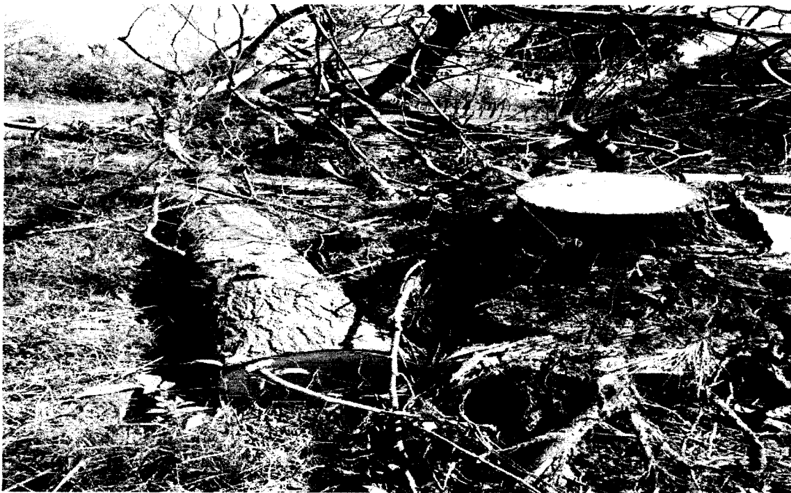
Imagen 4. Tocón y fuste del árbol Muñeco ( Cordia eriostigma ).