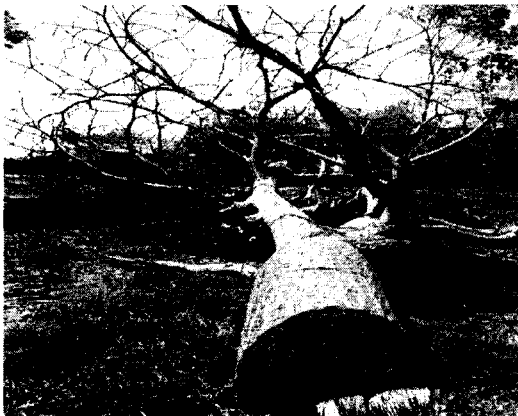
Ilustración 2 Tocón y fustes de árboles apeados de la especie Barrigón ( Pseudobombax septenatum ).

La metodología de cubicación se basó en una reconstrucción de los individuos en pie a través de la toma de medidas de tocones e indagación, con el objetivo de establecer las medidas dendrométricas de DAP y Altura total.