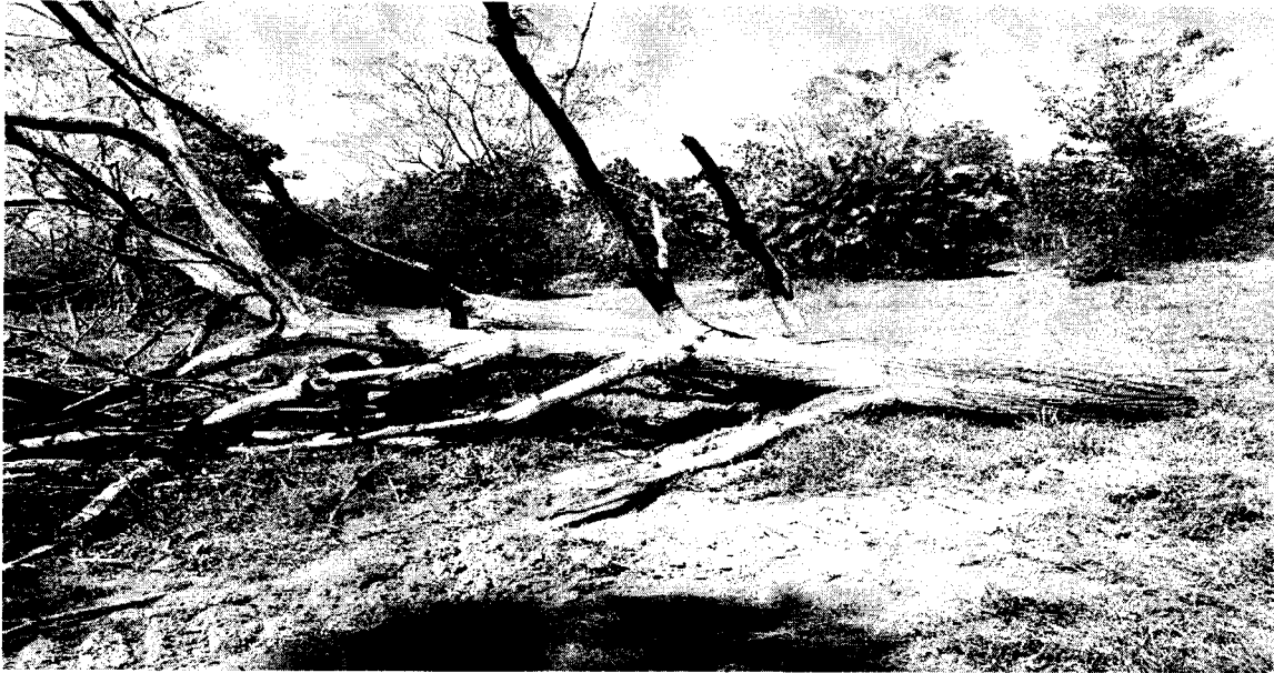
Imagen 3. Tocón y fuste del árbol talado de la especie Neen ( Azadirachta indica ).