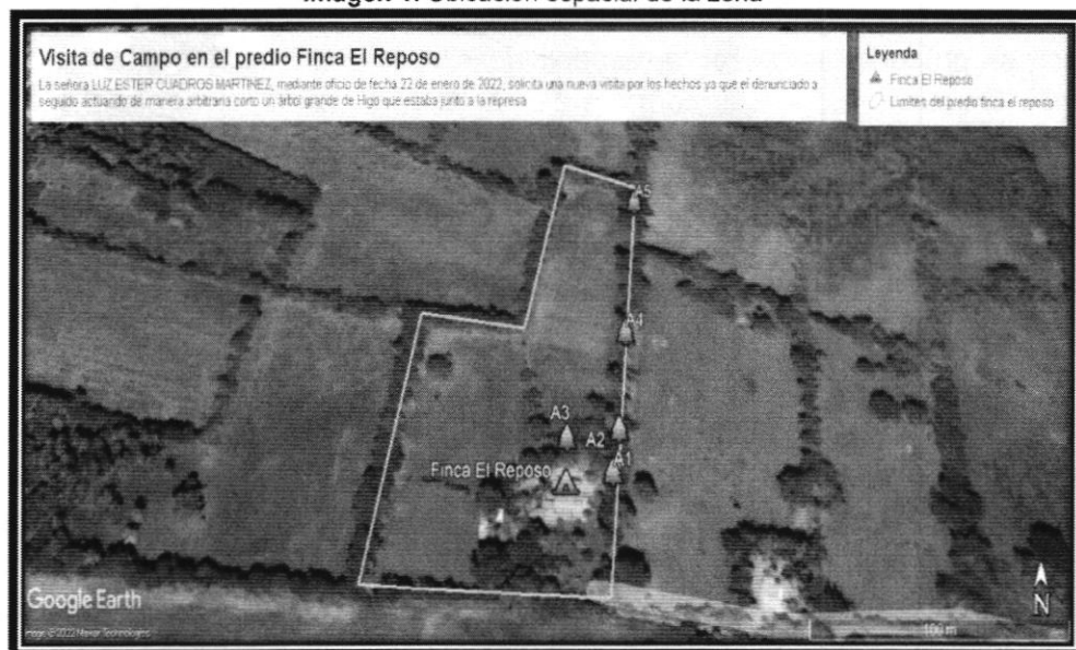
Imagen 1. Ubicación espacial de la zona