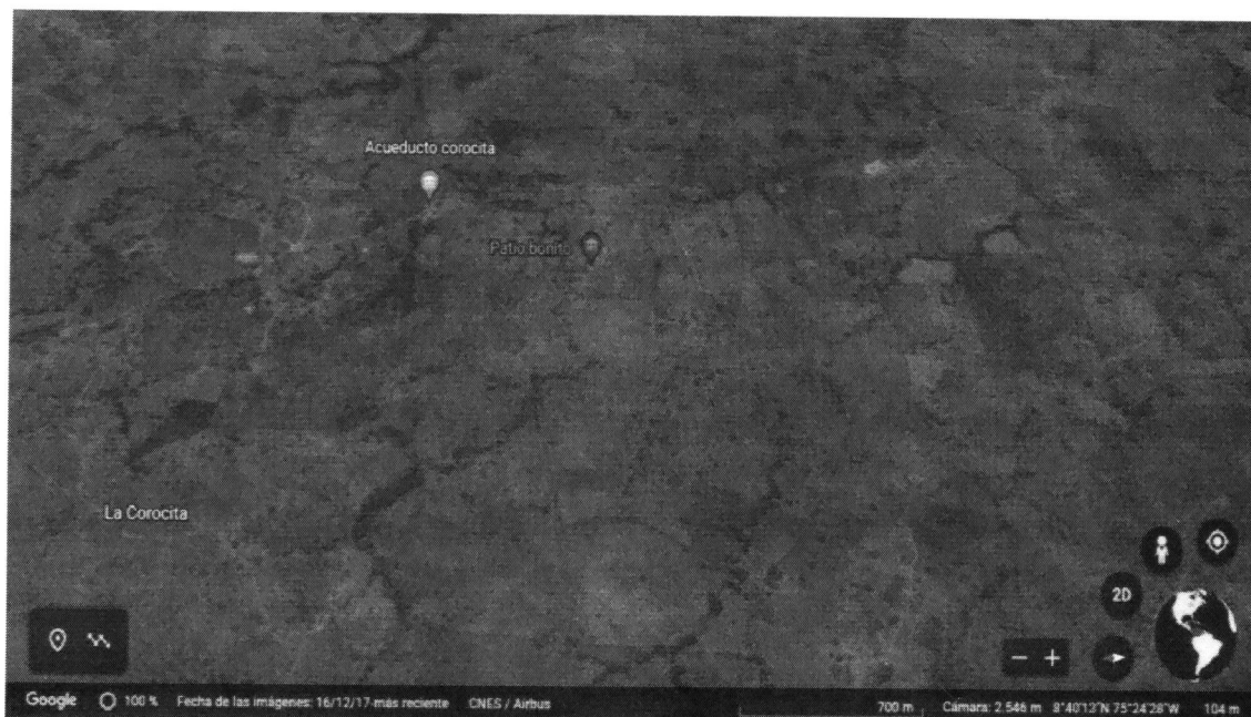
Imagen 1. Ubicación espacial de la finca donde se realizó la presunta actividad.