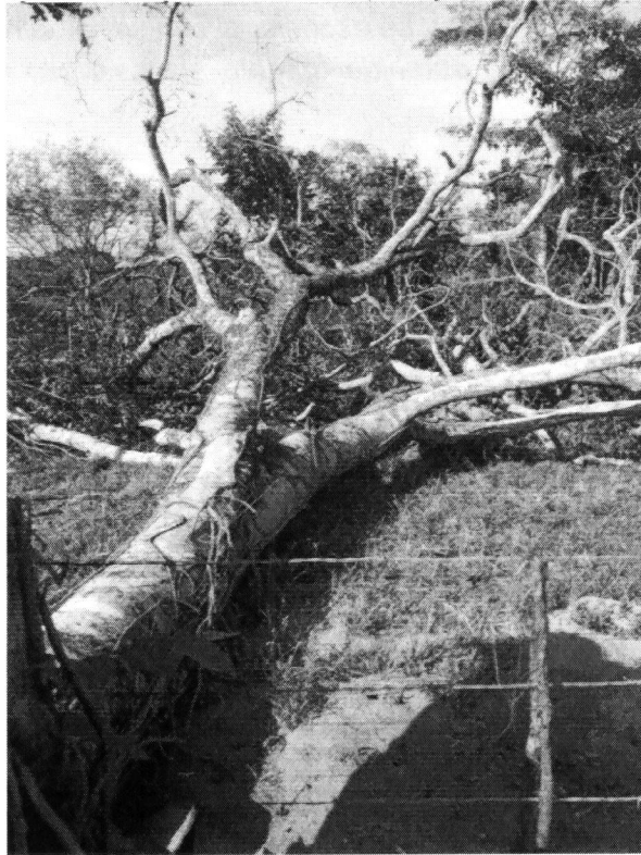
Imagen 6. Tocón y material vegetal encontrado del individuo de la especie Hobo ( Spondias mombin ).