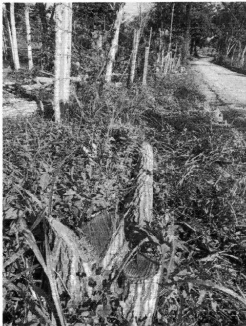
Imagen 2. Tocón y material vegetal encontrado del individuo de la especie Cedro ( Cedrela odorata ), el cual presentaba un buen estado físico v fitosanitario.