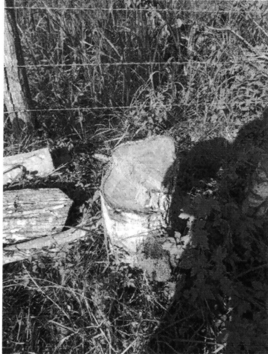
Imagen 4. Tocón y material vegetal encontrado del individuo de la especie Chitúa ( Pseudobombax septenatum ).

Imagen 3. Tocón del individuo de la especie Vara de humo ( Cordia alliodora ), el cual presentaba un buen estado físico y fitosanitario.