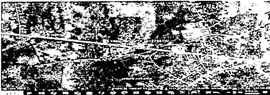
Ilustración 1. Localización del establecimiento depósito de Maderas Moisés

En actividades de vigilancia y control para prevenir la deforestación y el tráfico ilegal de madera, integrantes de la DIRECCION DE CARABINEROS Y POTECCION AMBIENTAL POLICÍA METROPOLITANA DE MONTERÍA, GRUPO POLICÍA AMBIENTAL Y RECURSOS NATURALES CORDOBA, ingresan al establecimiento comercial Deposito de Maderas Moisés, ubicado el barrio Belén carretera principal vía Lórica en el municipio de Tuchin – Córdoba con coordenadas geográficas 09° 11'12" N-75°33'40" W, el 17 de junio de 2025 a las 10:30 horas, realizaron la incautación de aproximadamente 7.0 m3 de madera Camajón ( Sterculia apetala ), en primer grado de transformación la cual fue dejada en custodia del establecimiento depósito maderas MOISES, administrado por el señor ANDYS MIGUEL MUENTES PÉREZ, identificado con cedula N° 1.003.061.050 expedida en el municipio de Chima Córdoba, de 35 años de edad, oficios baríos, unión libre, residente en el municipio de Tuchin Barrio Belén sin nomenclatura, teléfono celular 3215161856.