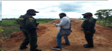
Foto N° 8. Profesionales GGR - CVS en compañía de policía Nacional