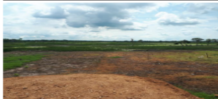
Foto N° 7. Área cenagosa que hace parte del Humedal Berlin a pocos metros de la obra