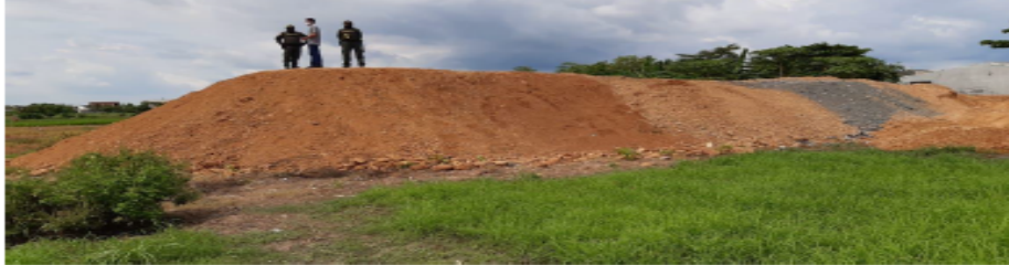
Foto N° 4. Vista de la disposición del material – altura aproximada de 4 metros

RESOLUCIÓN No. 2-7456 FECHA: 14 de Septiembre de 2020