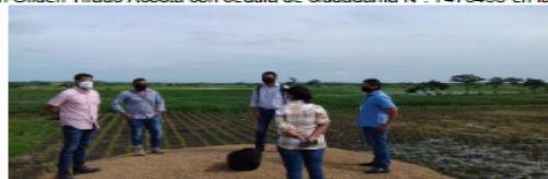
Foto N° 11 . Profesionales CVS y Alcaldía de Montería visita del 20 de junio 2020