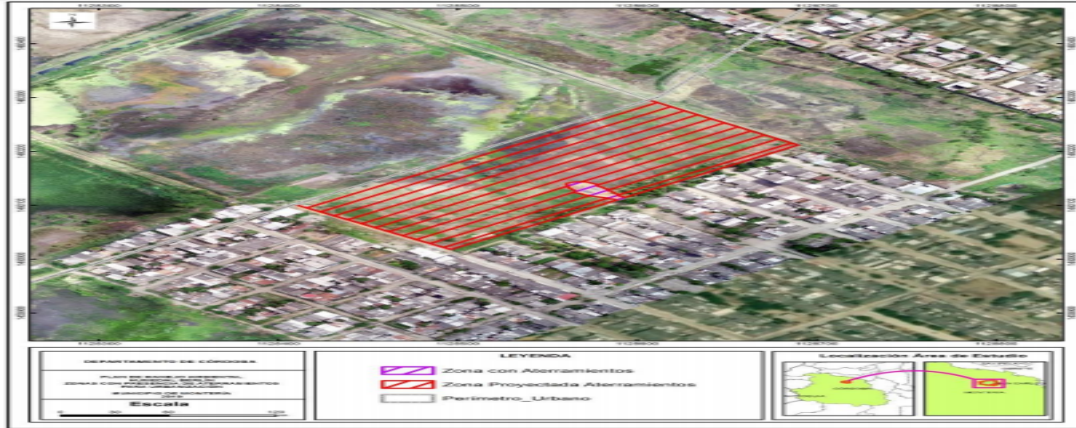
Figura No. 1 Localización General del sitio inspeccionado.

RESOLUCIÓN No. 2-7456 FECHA: 14 de Septiembre de 2020