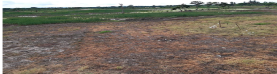
Foto N° 6. A pocos metros de donde esta la disposición de material de relleno se observa se observa área cenagosa que hace parte del Humedal Berlin