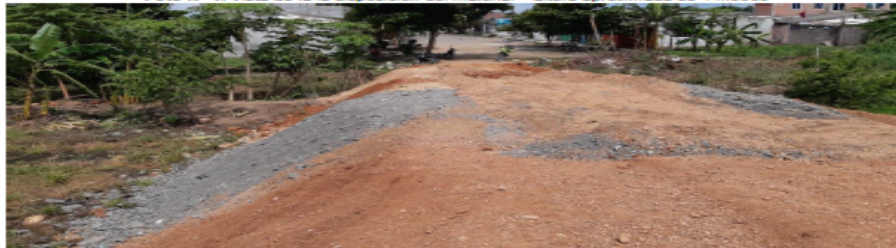
Foto N° 5. Vista de la disposición del material presuntamente para relleno o aterramiento.