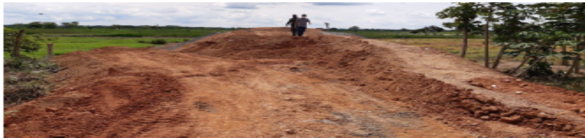
Foto N° 2. Recorrido sobre material dispuesto que actualmente conforma un terrapien