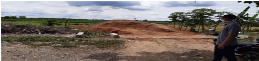
Foto N° 1. Profesionales realizando la inspección, PMA Humedal Berlín – al inicio de la disposición del material