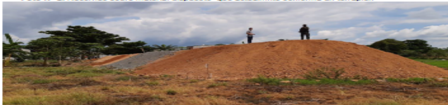
Foto N° 3. Vista de la disposición del material – altura aproximada de 4 metros