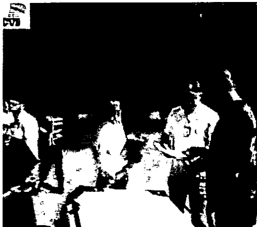
Fotografía 3. Establecimiento "BAR LA SUCURSAL", 2025