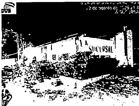
Fotografía 2. Medición de emisión de ruido en "BAR LA SUCURSAL", 2025