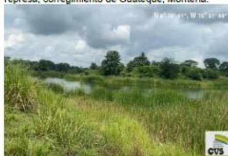
Imagen No.8. Proliferación de vegetación en área de represa.