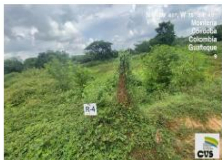
Imagen No.5. Proliferación de vegetación en área de represa, corregimiento de Guateque, Montería.