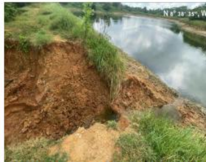
Imagen No.2. Evidencia de erosión en ribera de represa, corregimiento de Guateque, Montería.