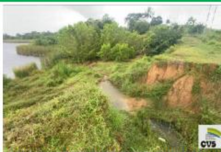
Imagen No.12. Daño significativo terraplén, corregimiento de Guateque, Montería.