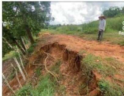
Imagen No.1. Evidencia de erosión en ribera de represa, corregimiento de Guateque, Montería.