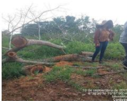
Imagen No. 16. Evidencia tala de arboles