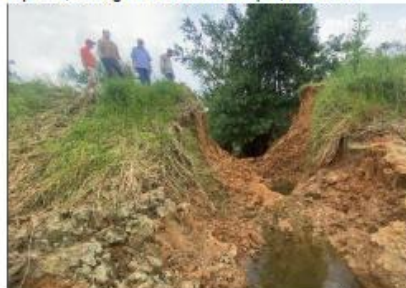
Imagen No.3. Ruptura significativa de terraplén.