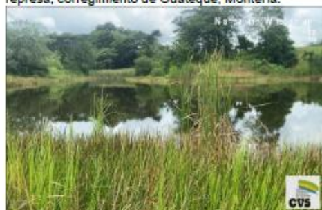
Imagen No.7. Proliferación de vegetación en área de represa.