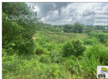
Imagen No.6. Proliferación de vegetación en área de represa, corregimiento de Guateque, Montería.