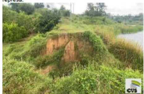
Imagen No.9. Daño significativo terraplén, corregimiento de Guateque, Montería.