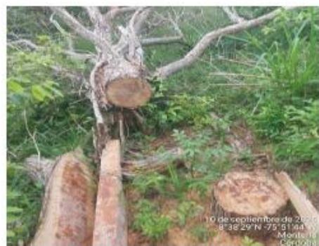
Imagen No. 13. Evidencia tala de arboles