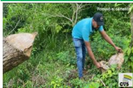
Imagen No.11. Evidencia presunta tala de árboles, en el predio objeto de la visita.