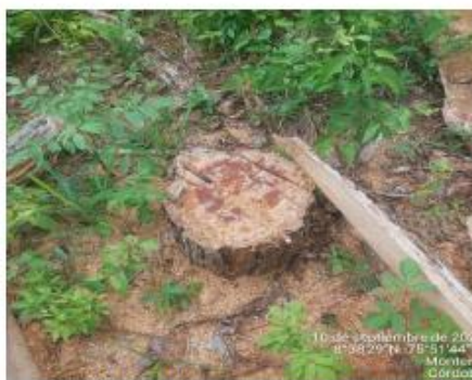
Imagen No. 14. Evidencia tala de arboles