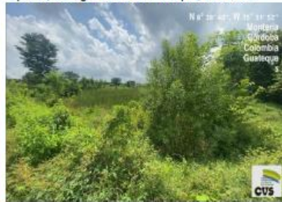
Imagen No.4. Proliferación de vegetación en área de represa, corregimiento de Guateque, Montería.