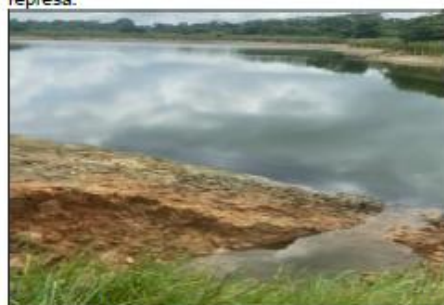
Imagen No.10. Daño significativo terraplén, corregimiento de Guateque, Montería.