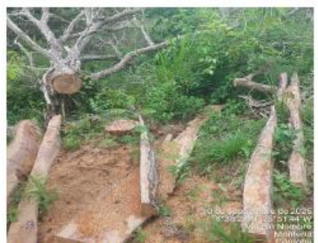
Imagen No.15. Evidencia tala de arboles