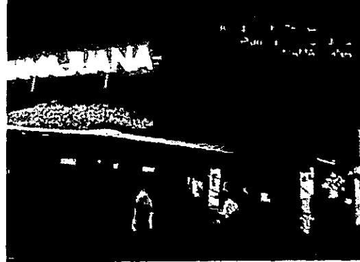
Fotografía 2. Medición de emisión de ruido en "MAMAJUANA CROSSOVER J.O", 2025