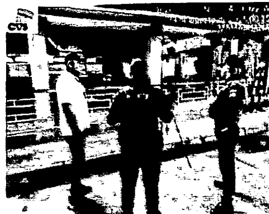
Fotografía 3. Establecimiento "MAMAJUANA CROSSOVER J.O", 2025