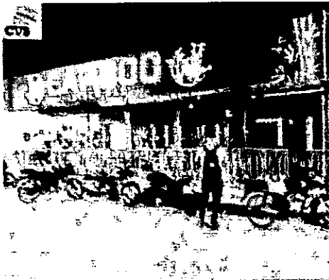
Fotografía 1. Establecimiento, "BAMBOO DISCO BAR", 2025

Finalmente, se termina el procedimiento y se socializa que existe contaminación por emisión de los niveles de ruido de acuerdo con los resultados obtenidos, toda vez, que se realizan los ajustes a los componentes tonales, impulsivos y de baja frecuencia utilizando la metodología de la resolución 0627 de 2006 y análisis por parte del laboratorio acreditado por el IDEAM, Control de Contaminación LTDA.