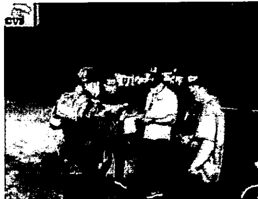
Fotografía 2. Socialización del resultado de la medición, "BAMBOO DISCO BAR", 2025