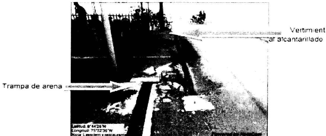
Foto No.3. Punto de vertimiento aguas grises al alcantarillado

- Se puede evidenciar que las aguas grises no domesticas producidas por la actividad de lavado de vehículos son tratadas en dos trampas de arena y después vertidas en el alcantarillado mediante un tubo, no se observa vertimiento de aguas grises no domesticas a los canales de aguas lluvias ubicados en la calle.