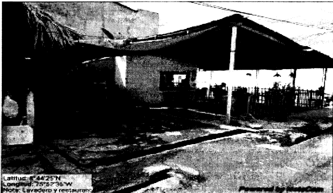
Foto No.1. Placa y cunetas.

- Para la prestación del servicio de lavado de vehículos, cuentan con una placa en concreto y las aguas grises generadas en el lavado, son recogidas por unas cunetas de cemento y atendidas en 2 cajas de registro o trampa de arena y posteriormente son dispuestos en el alcantarillado.