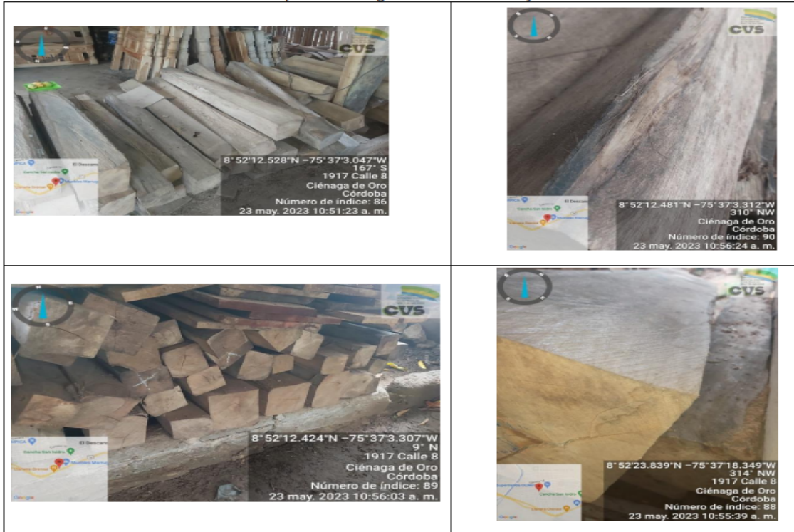
Imagen 2. Depósito de madera El Tecal, ubicado en la carrera 25 D No G 2-20 del barrio San Isidro, ubicada en el municipio de Ciénaga de Oro. 23 de mayo de 2023

Fuente: Subdirección de Gestión Ambiental, 23/05/2023