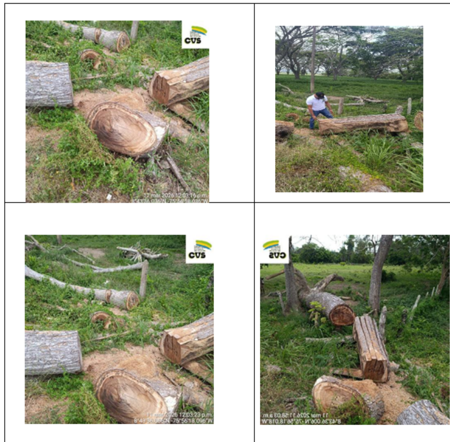
Imagen 2. peritaje del producto forestal decomisado ubicado en la vía que de Montería conduce a la, vereda jaraquiel Municipio de montería Córdoba.

En este sentido, se evidencia que, conforme a lo dispuesto en la Sección 9 del Decreto 1076 de 2015, la actividad desarrollada no contaba con la autorización correspondiente para el aprovechamiento forestal de árboles aislados por parte de la Autoridad Ambiental Competente – CVS, lo que permite inferir que dicha intervención se efectuó de manera no autorizada.