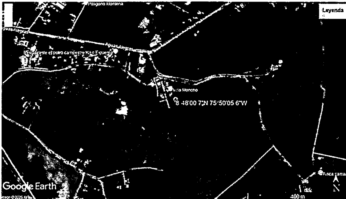
Tabla 1 Ubicación geográfica Estacion CVS Mocari.

El material vegetal incautado de aproximadamente 400 hojas de la especie de nombre común palma amarga ( Sabal mauritiformis ), Los cuales son trasladados y dejados en custodia en la Subse de la Corporación Autónoma de los Valles del Sinú y del San Jorge (CVS) Barrio el Ceibal Vía a Aguas Negras del municipio de Montería córdoba en las coordenadas geográficas: 08° 48' 0.69" N 075° 50' 5.61" W