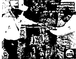
Foto 3. Base del fuste con necrosis