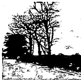
Foto 1. Vista general de los tres árboles afectados