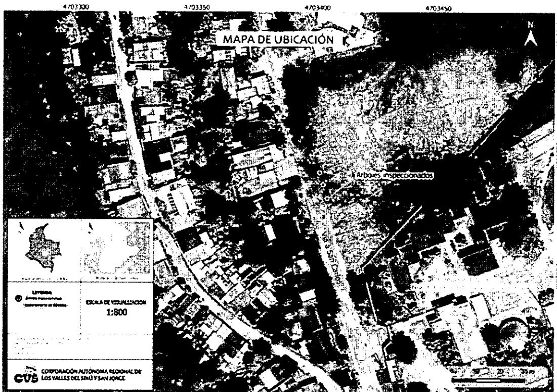
Figura 1: Localización de Árboles - Jurisdicción de San Carlos, Córdoba.

Los individuos afectados se encuentran en la zona urbana del municipio de San Carlos, Córdoba, en la berma contigua a una vía principal. La coordenada geográfica de referencia registrada en campo corresponde aproximadamente a N 8°48'13,50" y W 75°41'49,83". El entorno inmediato incluye andenes, redes eléctricas aéreas y un predio con movimiento de tierras asociado a actividades constructivas.