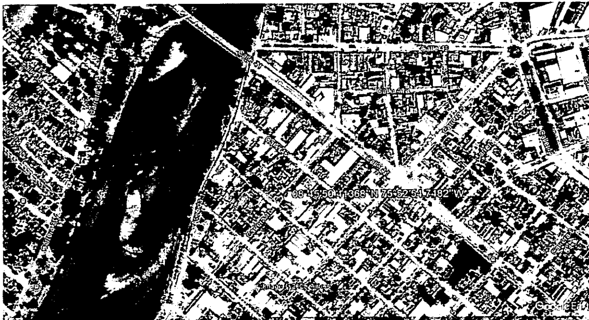
Ilustración 1. Localización del establecimiento Maderas Del Sinú