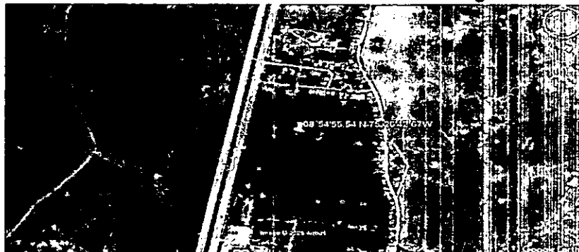
Ilustración 1. Localización de la Subsele Sahagún CVS