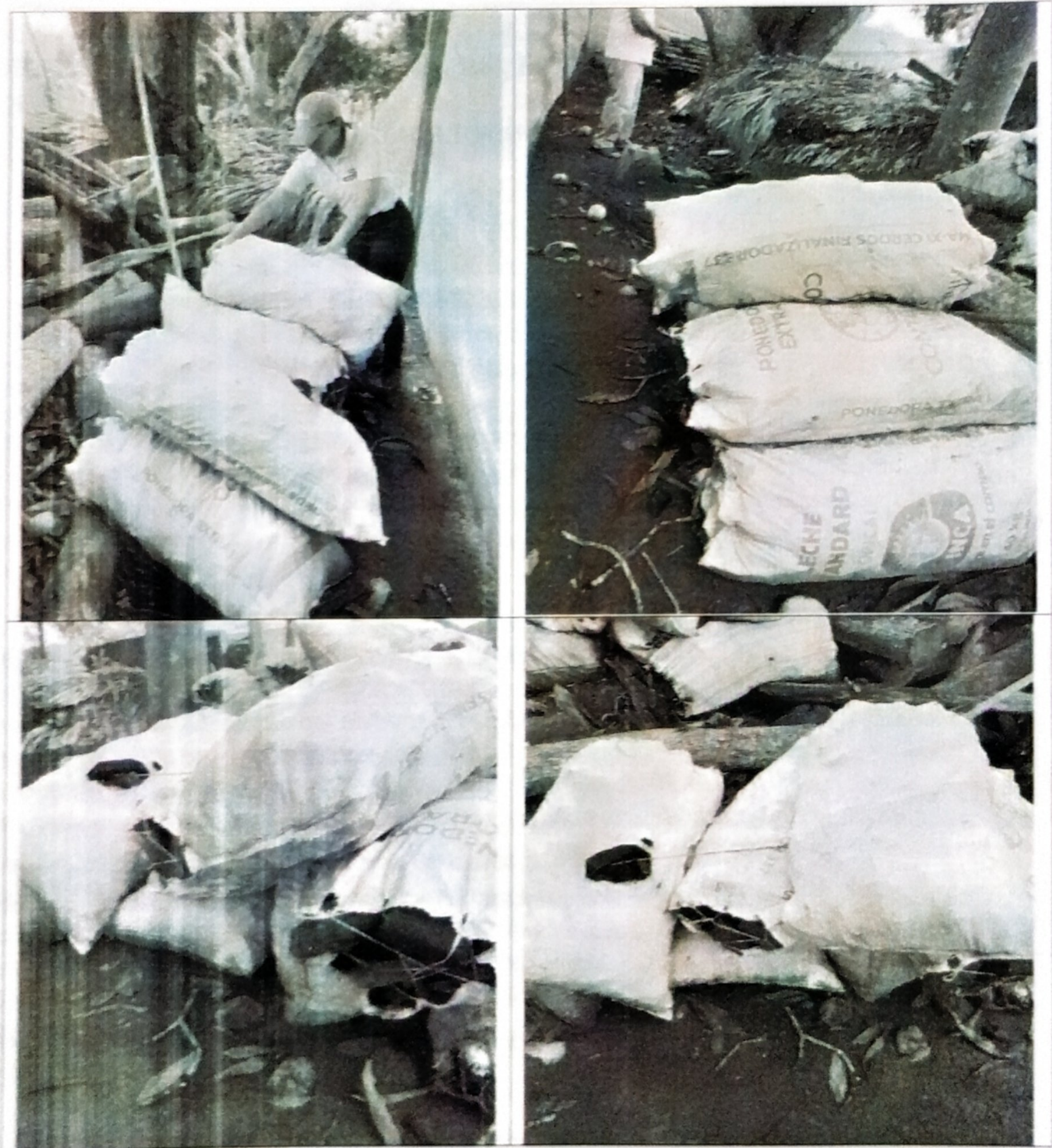
Ilustración 1. Registro fotográfico del producto forestal no maderable carbón vegetal en proceso de decomiso preventivo

Según el cálculo realizado, se dejó a disposición un total de ciento veintiocho (128) kilogramos (kg) de carbón vegetal, el cual no contaba con el permiso de obtención y transformación de la fuente del producto forestal.