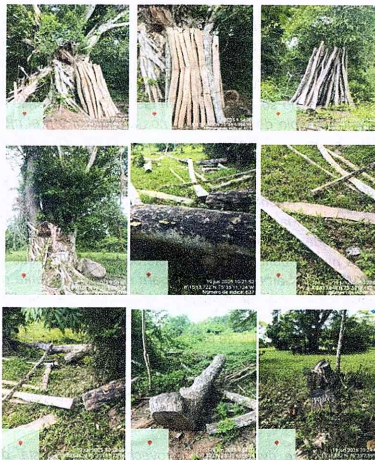
Ilustración 2. Individuos arbóreos presuntamente aprovechados.

La especie, el DAP, la altura calculada y el volumen obtenido durante el desarrollo de la visita, se pueden observar en la Tabla 2.