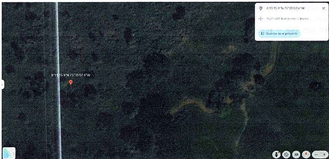
Ilustración 1. Ubicación espacial de las parcelas el Trono en el municipio de Buenavista, departamento de Córdoba.