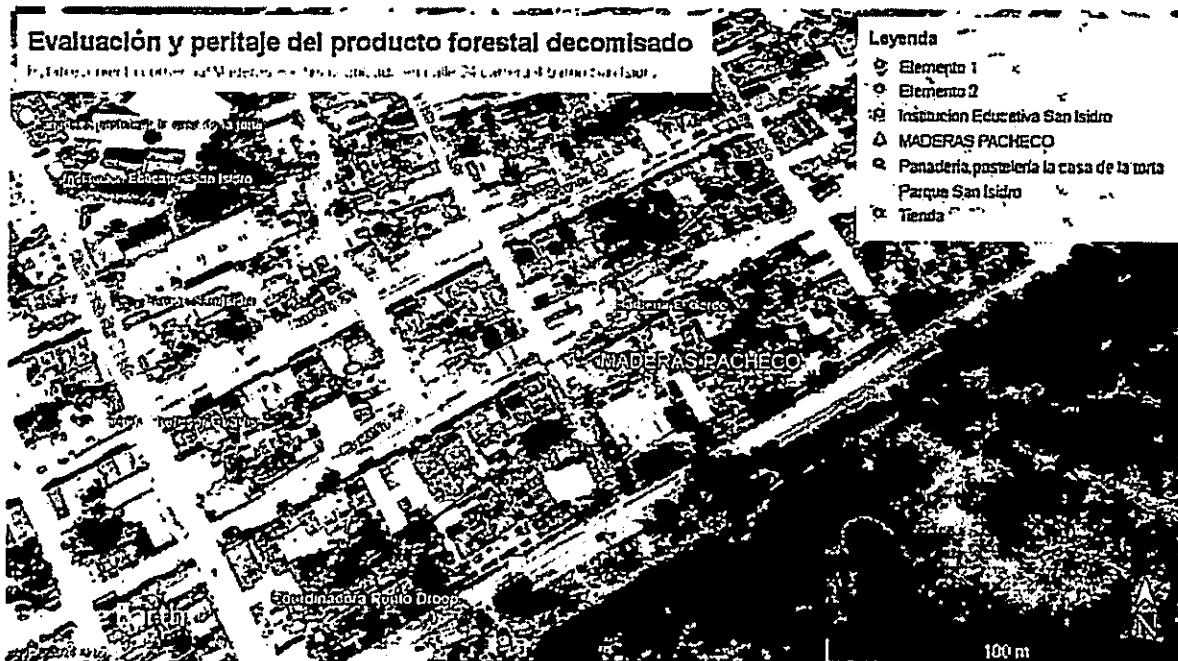
Ilustración 1. Localización del establecimiento Maderas Pacheco

El producto forestal incautado aproximadamente 3 m 3 de la especie con características semejantes conocido con nombre común Roble (Tabebuia rosea), son dejados en custodia del señor Remberto Antonio Pacheco Medina, identificado con cédula de ciudadanía N° 2.760.373 en depósito Maderas Pacheco, ubicado en la calle 24 carrera 4 del barrio San Isidro, ubicada en el municipio de Ciénaga de Oro - Córdoba.