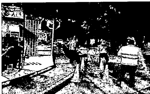
Fotografía 1. Establecimiento, BAR Y COMIDAS EL PASÓN - ACHIQUE BAR, 2023

En ese orden de ideas, finalmente se termina el procedimiento y se socializa que existe contaminación por emisión de los niveles de ruido de acuerdo con los resultados obtenidos, toda vez que se realizan los ajustes a los componentes tonales, impulsivos y de baja frecuencia utilizando la metodología de la resolución 627 de 2006 y análisis por parte del laboratorio acreditado por el IDEAM Control de Contaminación LTDA.