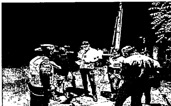
Fotografía 2. Socialización del resultado de la medición, BAR Y COMIDAS EL PASÓN - ACHIQUE BAR, 2023