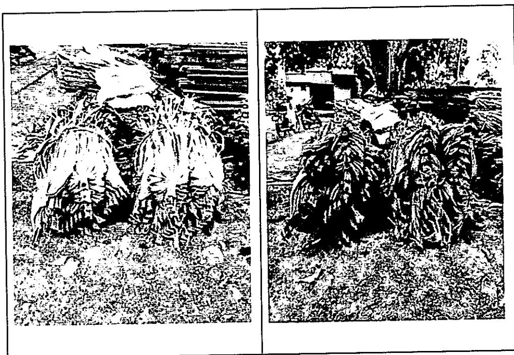
Figura 1. Producto forestal no maderable decomisado.

Fuente: Subdirección de Gestión Ambiental, 02/07/2024