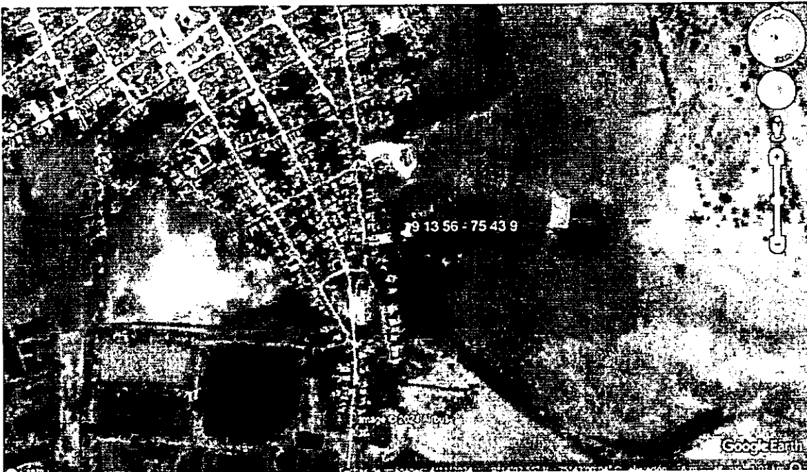
Ilustración 1. Localización del establecimiento comercial carpintería el Gordo