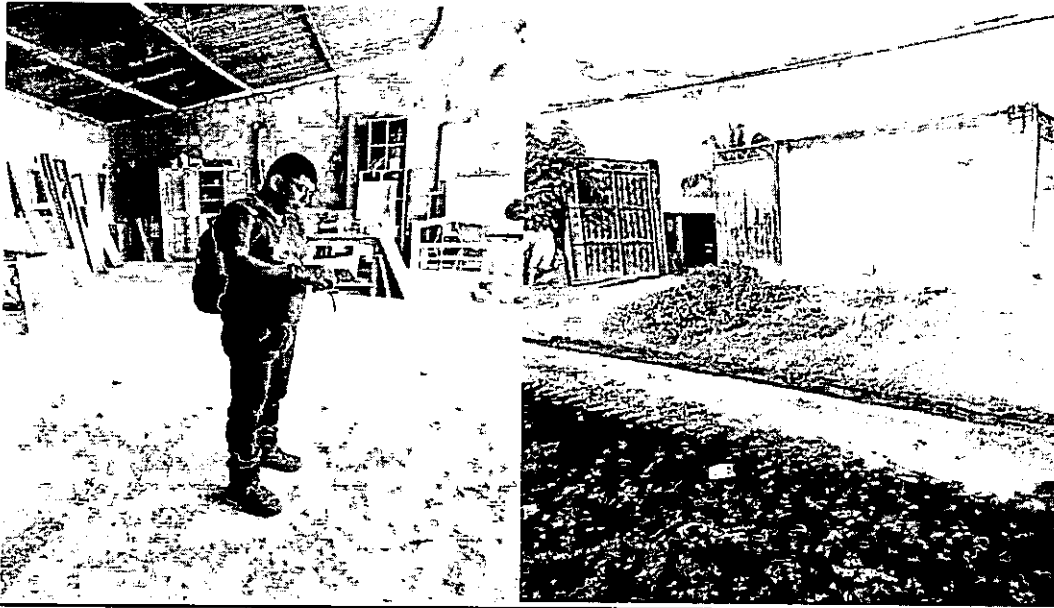
imagen 2 establecimiento comercial Carpintería DON PABLO ubicado en la Carrera 7 # 12 -24 Barrio la Candelaria del municipio de Purísima,