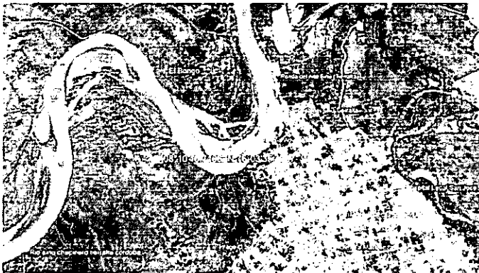
Ilustración 1. Localización del establecimiento Deposito Donde El Buevas

Se realizó recorrido de inspección en el establecimiento comercial Deposito Donde El Buevas, el cual se encuentra establecido en la carrera 13#3-20 del barrio El Prado del municipio de Tierralta, departamento de Córdoba, en las coordenadas geográficas 08°10'40.7406" N 76°03'35.4787" W