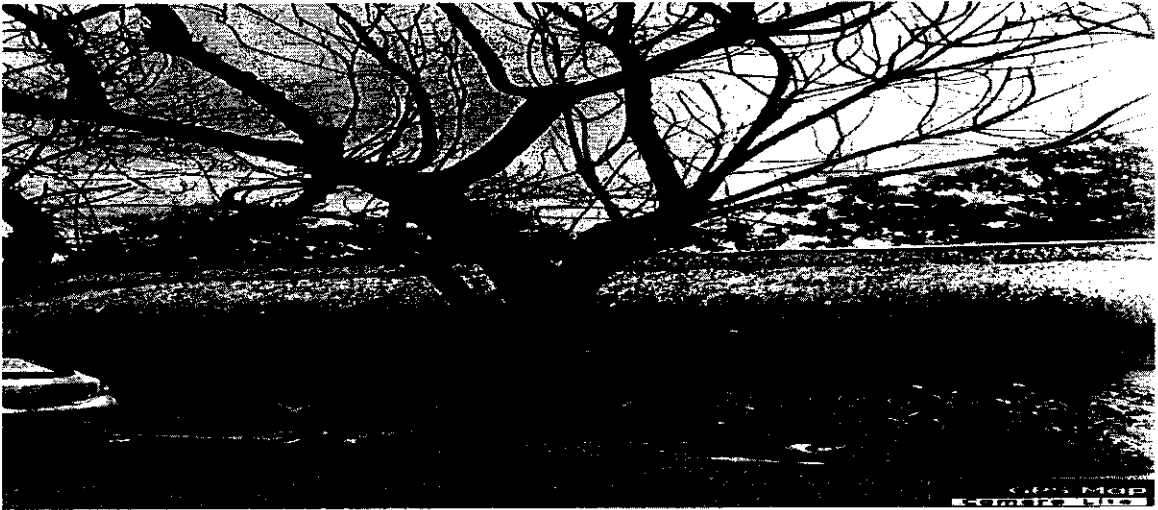
Imagen 5. Árbol N° 4 de la especie Neem ( Azadirachta indica ), el cual presenta una leve inclinación en su fuste.

Imagen 4. Árbol N° 3 de la especie Neem ( Azadirachta indica ), él presenta ramificaciones extensas, las cuales se encuentran parcialmente secas.