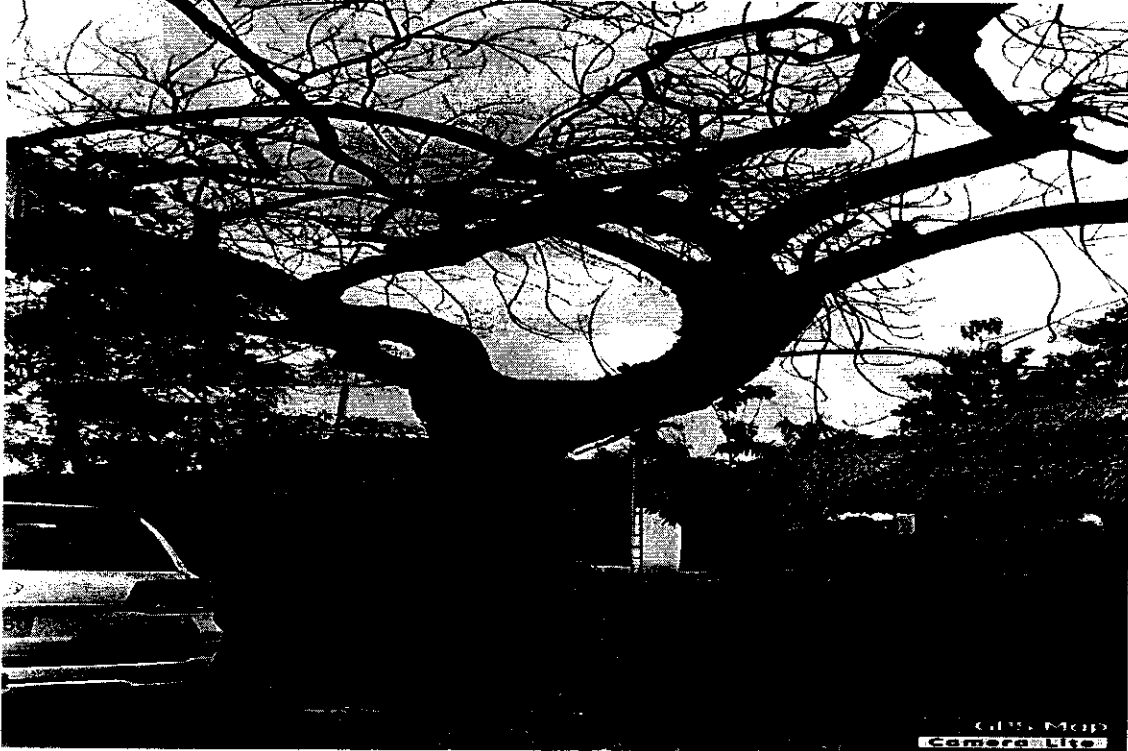
Imagen 3. Árbol N° 2 de la especie Neem (Azadirachta indica), el cual presenta raíces expuestas, las cuales se encuentran descubiertas.

Imagen 2. Árbol N° 1 de la especie Neem (Azadirachta indica), él se encuentra parcialmente seco.