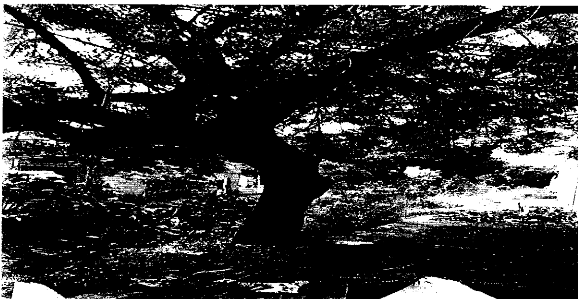
Imagen 8. Raíces descubiertas del individuo N°2 de la especie Neem ( Azadirachta indica ).