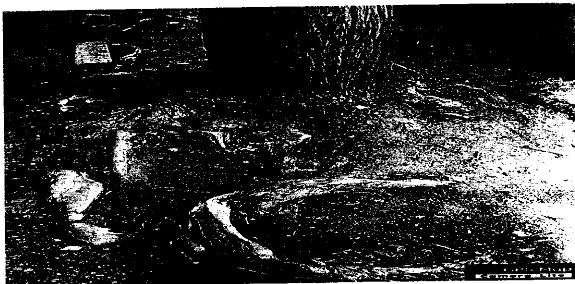
Imagen 8. Canal de aguas lluvias de la vereda Las Parcelas del municipio de Cereté, departamento de Córdoba.