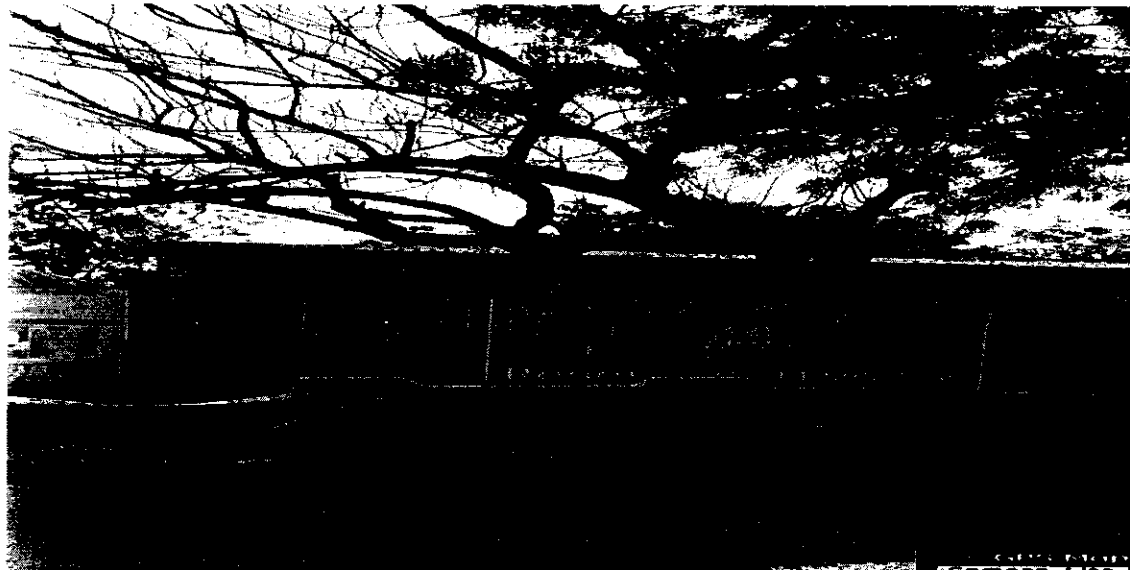
Imagen 7. Árbol N° 6 de la especie Neem ( Azadirachta indica ), el cual presenta anillamiento en su fuste