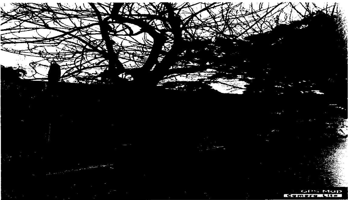
Imagen 6. Árbol N° 5 de la especie Neem ( Azadirachta indica ), él se encuentra raíces expuestas.

Imagen 5. Árbol N° 4 de la especie Neem ( Azadirachta indica ), el cual presenta una leve inclinación en su fuste.