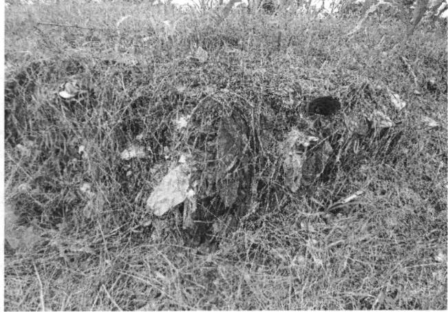
Foto 8. Afloramiento de residuos sólidos ocasionado por la erosión e inclinación.