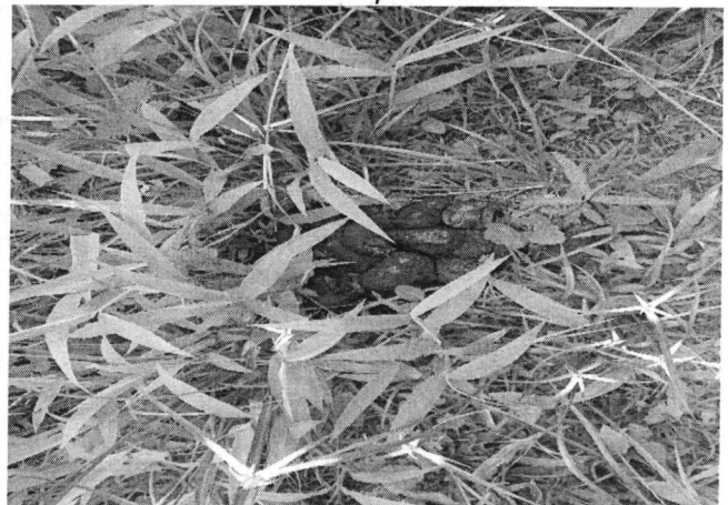
Foto 4. Eses de caballos presentes en el sitio.