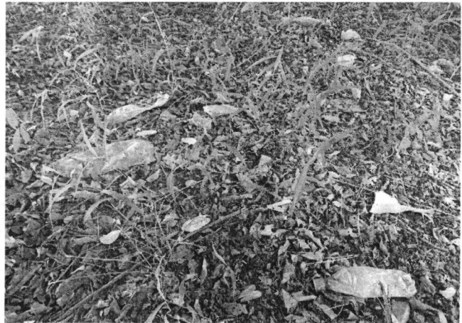
Foto 2. Residuos sólidos presente en el sitio.