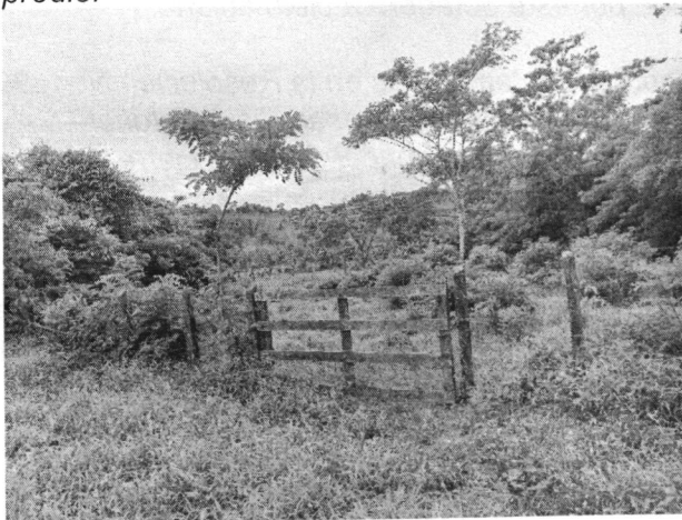
Foto 9. Puerta de entrada al predio.