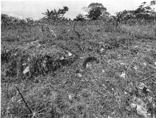
Foto 1. Aspecto general del sitio.