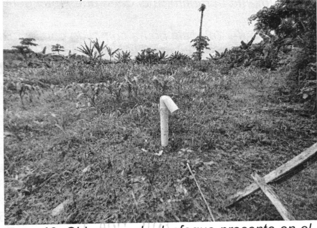
Foto 10. Chimenea de desfogue presente en el sitio.