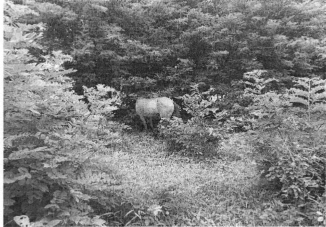
Foto 6. Equino presente en el sitio.