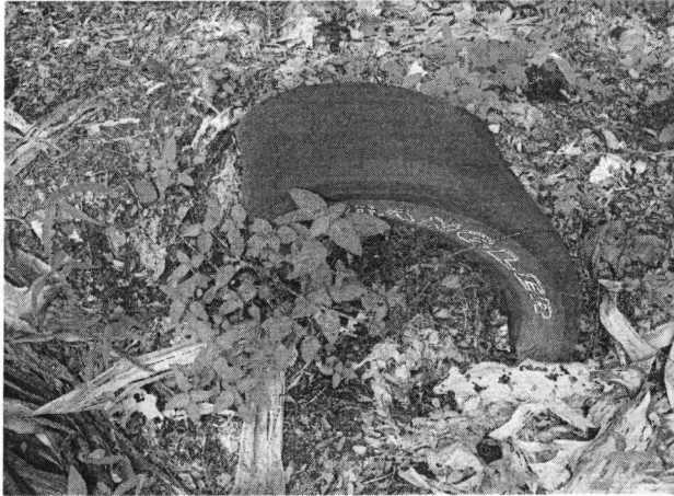
Foto 11. Residuos expuestos en el sitio