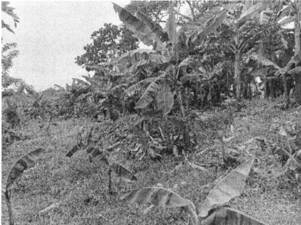
Foto 5. Cultivo de plátano presente en el sitio.