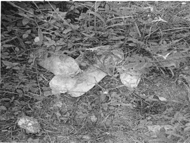
Foto 3. Exposición de residuos sólidos presentes en el sitio.