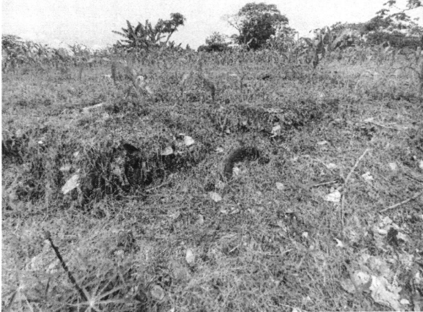
Foto 7. Pendiente erosionada presente en el predio.