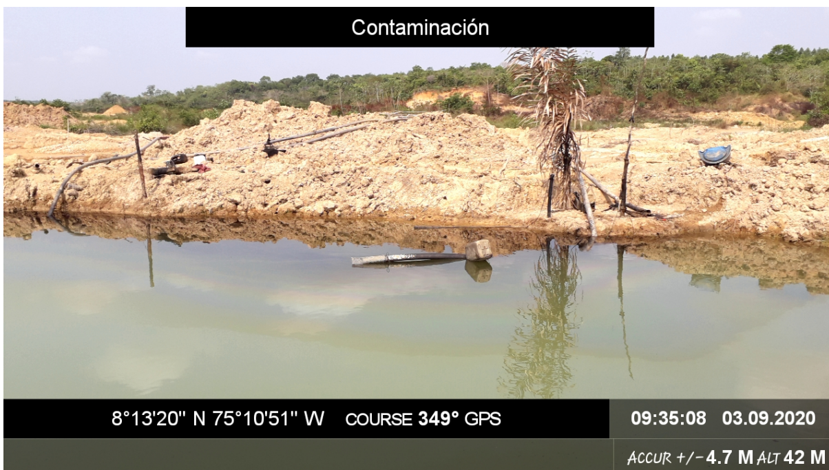
Foto 5. Zonas contaminadas por el uso de sustancias químicas tóxicas.