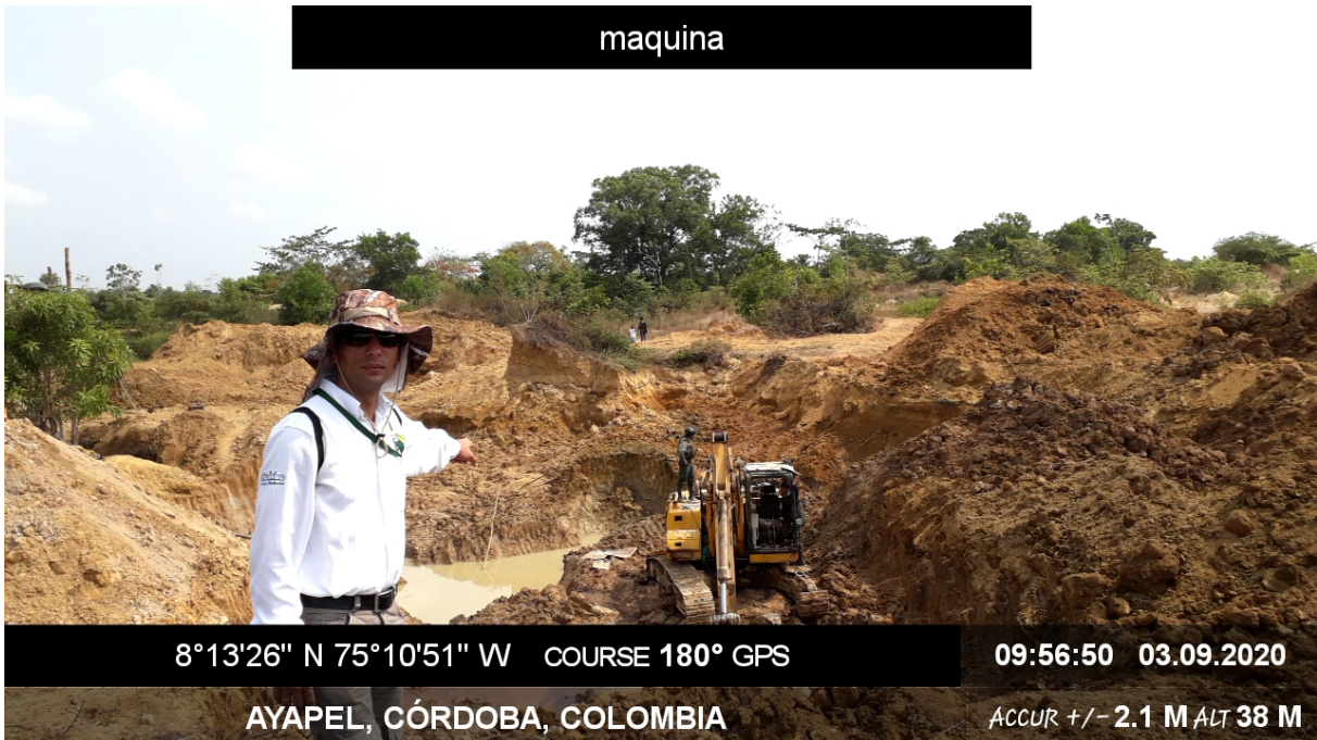
Foto 1. Retroexcavadora usada para la explotación ilegal de oro.