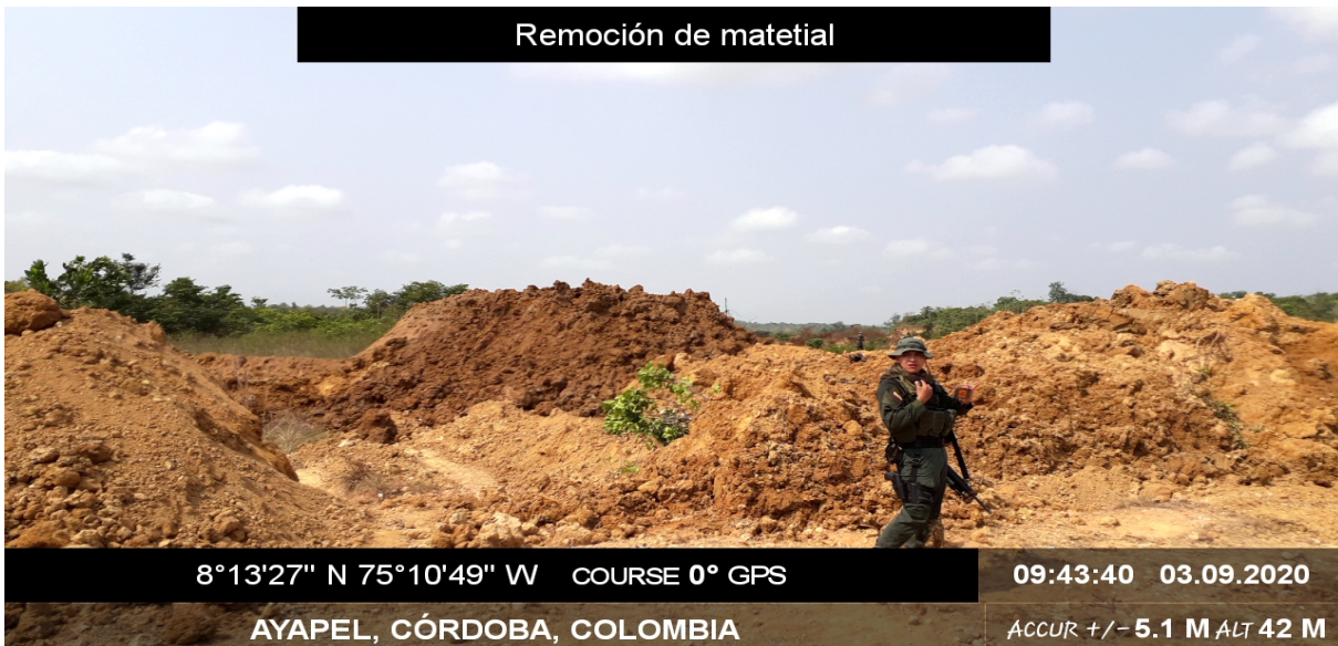
Foto 4. Patios de acopio para el almacenamiento de material estéril.