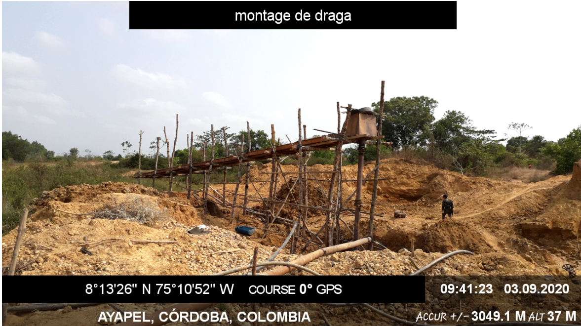
Foto 3. Infraestructura empleada para la recuperación ilícita del mineral de Oro.