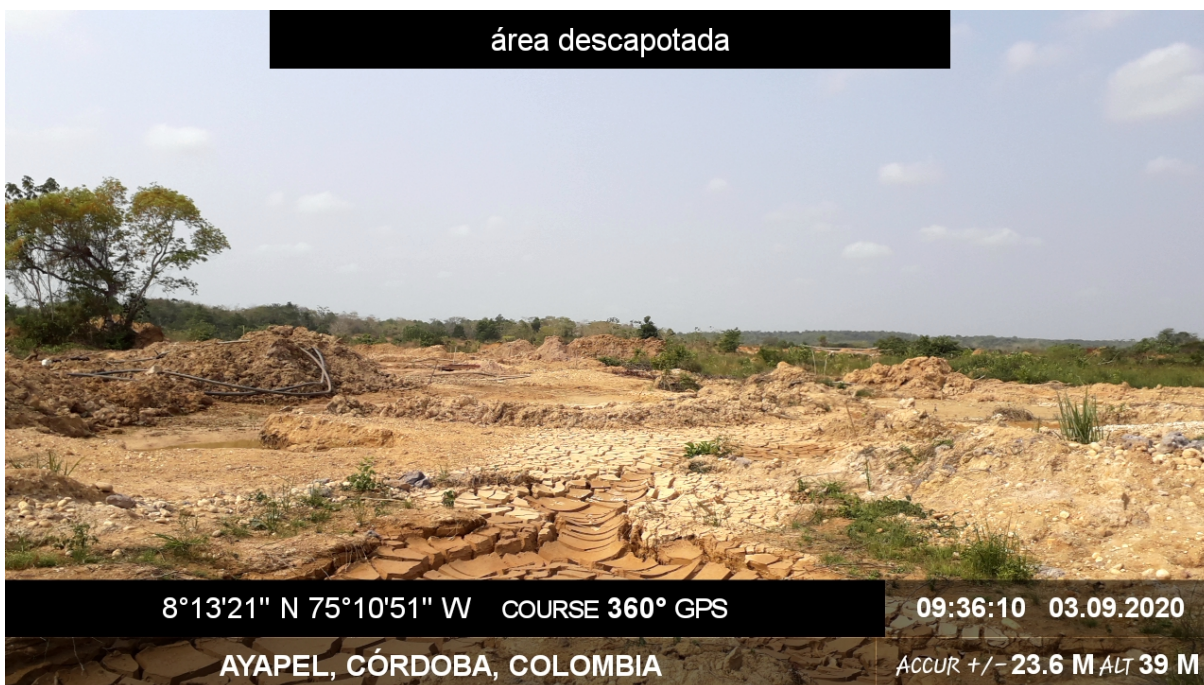
Foto 7. Zonas destruidas y contaminadas con sustancias tóxicas.