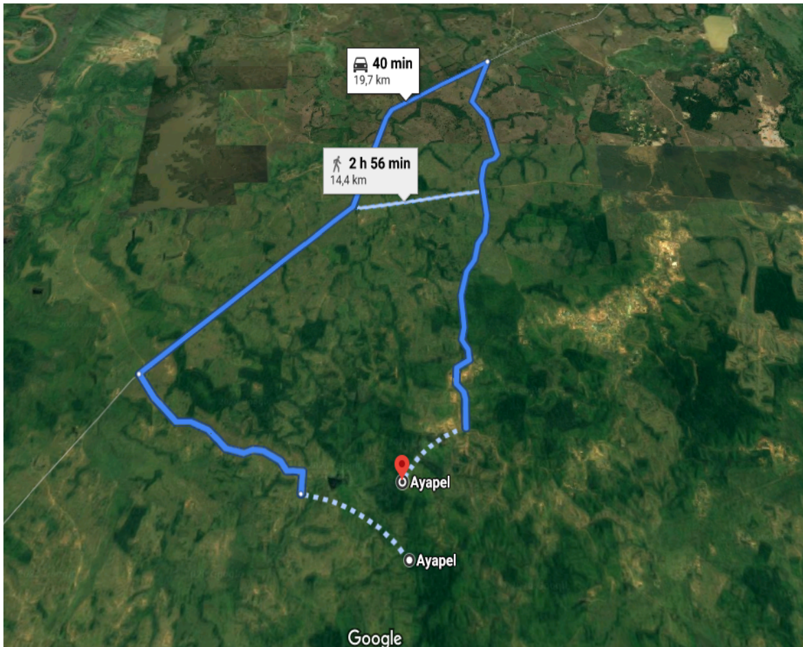
Ilustración 2. Acceso a la zona de explotación ilegal de Oro en el Municipio de Ayapel, Córdoba.

Al sitio de extracción ilícita de mineral de oro se llega por la vía que conduce de La Apartada - Ayapel, bajo las coordenadas N: 8°11'3" - W: 75°13'11".