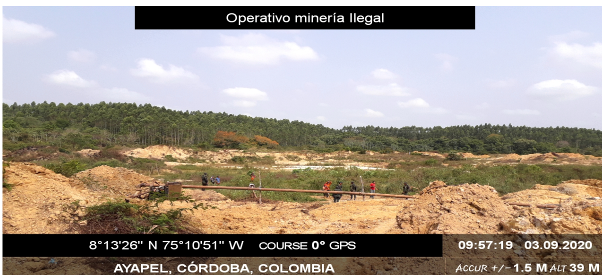
Foto 6. Extracción ilícita de mineral de Oro.