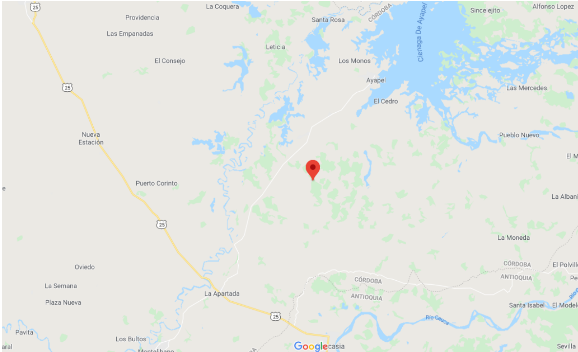
Ilustración 1: Localización Punto de Explotación Minera Ilegal