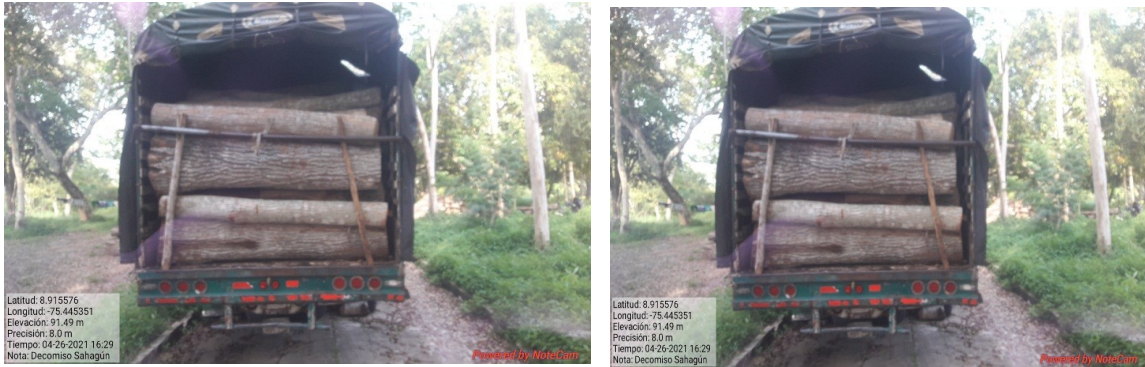
Imagen 1 y 2. Madera incautada

Cabe resaltar que la especie Roble (Tbebuia rosea), según la Resolución 1912 de 2017 no se encuentra en ningún grado de amenaza