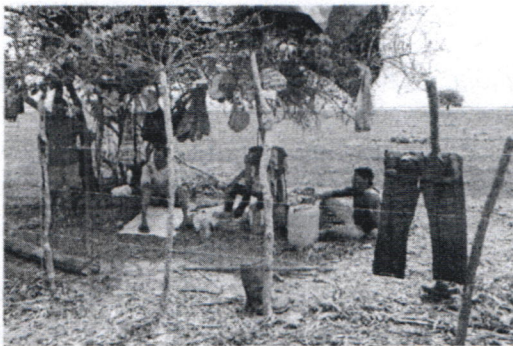
Figura # 9. Agricultores presentes en el predio al momento de la visita