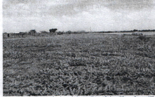
Figura # 2. Panorámica del predio y del cultivo de patilla