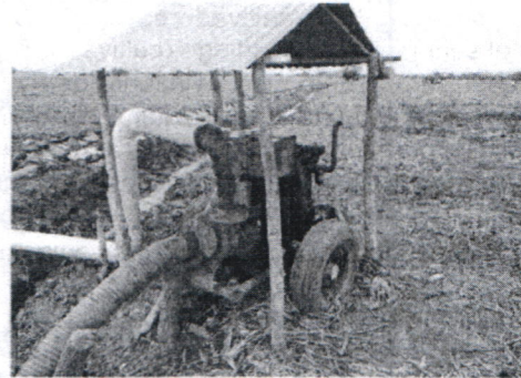
Figura # 8. Punto de captación de agua, motobomba de 8" y de tubería de conducción de agua