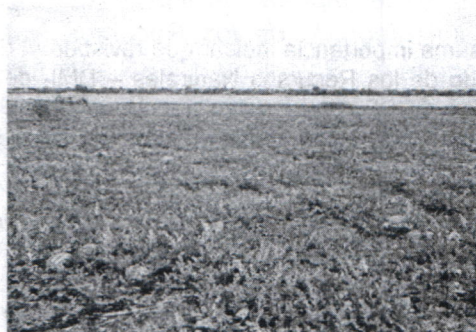
Figura # 12. Panorámica de los predios del cultivo de patilla en predios propios del humedal