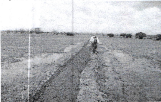
Figura # 3. Panorámica del predio, de canales y del cultivo de arroz