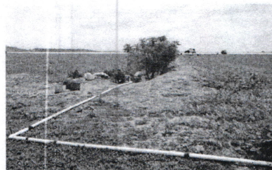
Figura # 5. Punto de captación de agua, de motobomba de 3", y de tubería de conducción de agua