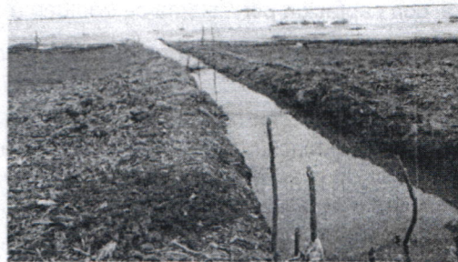
Figura # 10. Panorámica de canal de captación de agua desde la ciénaga grande del bajo Sinú en un sector perteneciente al municipio de Momil