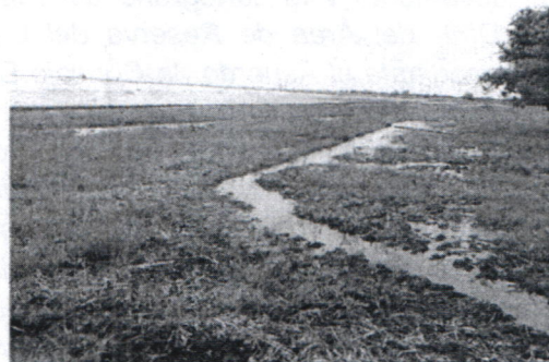
Figura # 11. Panorámica de los predios cultivados en las predios propios del humedal