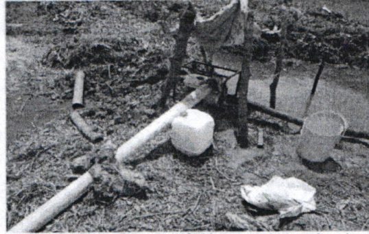
Figura # 4. Punto de captación de agua, de motobomba de 3", y de tubería de conducción de agua