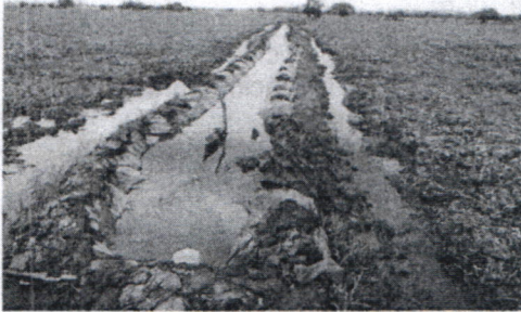
Figura # 7. Panorámica del canal para cultivo de arroz elaborado en tierra y recubierto por una subcapa aislante de suelo de polietileno