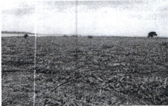
Figura # 1. Panorámica del predio y del cultivo de patilla