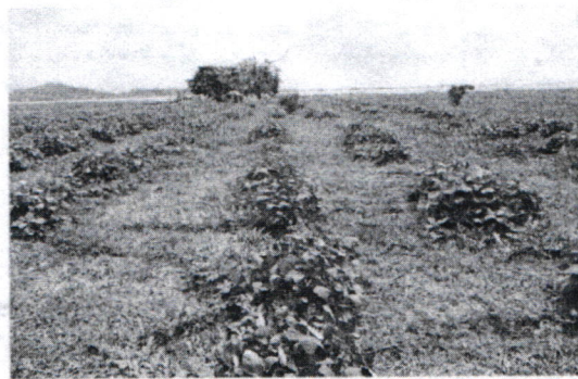
Figura # 6. Panorámica del predio y del cultivo de frijol