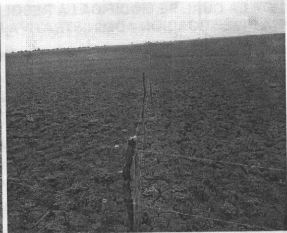
Foto No.2. Cerramiento eléctrico área de Ciénaga municipio de Chimá