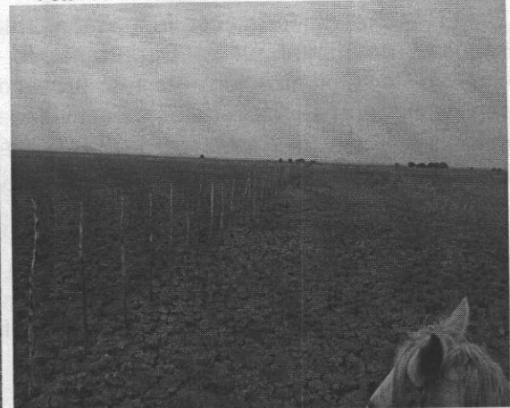
Foto No.4. Cerramiento área de Ciénaga municipio de Chimá

Las especies de árboles extraídas para el cerramiento, son conocidas como Dorada, Zuná y Pimiento.