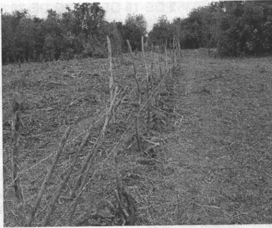
Foto No.1. Cerramiento área de Ciénaga municipio de Chimá