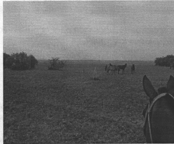
Actividad de ganadería al interior del área con cerramiento en Ciénaga en el m. Chimá.

Los puntos georeferenciados se detallan por medio de la siguiente tabla: