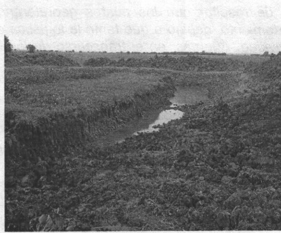
Construcción de embalse al interior del área con cerramiento en Ciénaga en el m. Chimá.