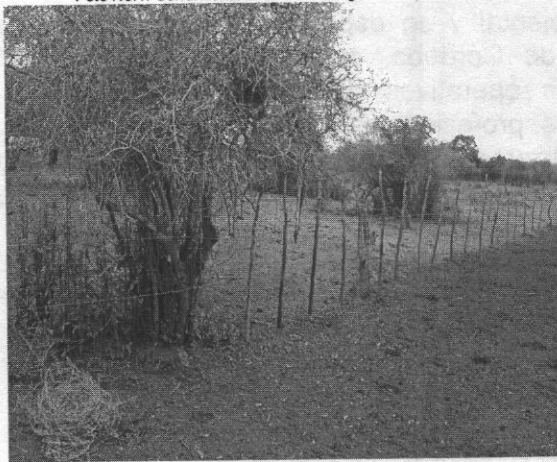
Foto No.3. Cerramiento área de Ciénaga municipio de Chimá