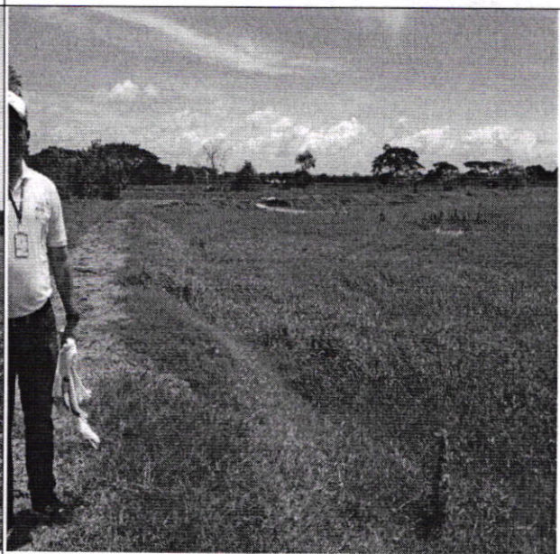
Figura 6. Vista de terraplén que ocasiona problemática.