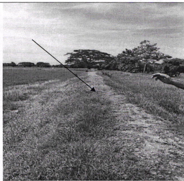
Figura 2. Terraplén que obstaculiza a los predios circunvecinos.