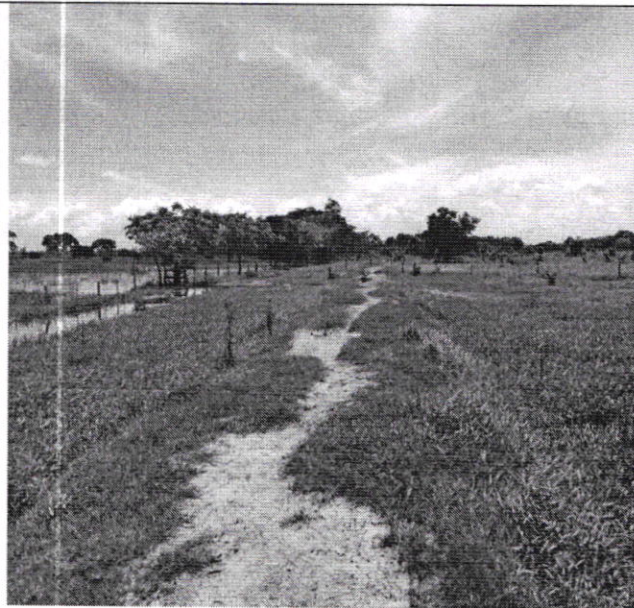
Figura 5. Vista de terraplén que ocasiona problemática.