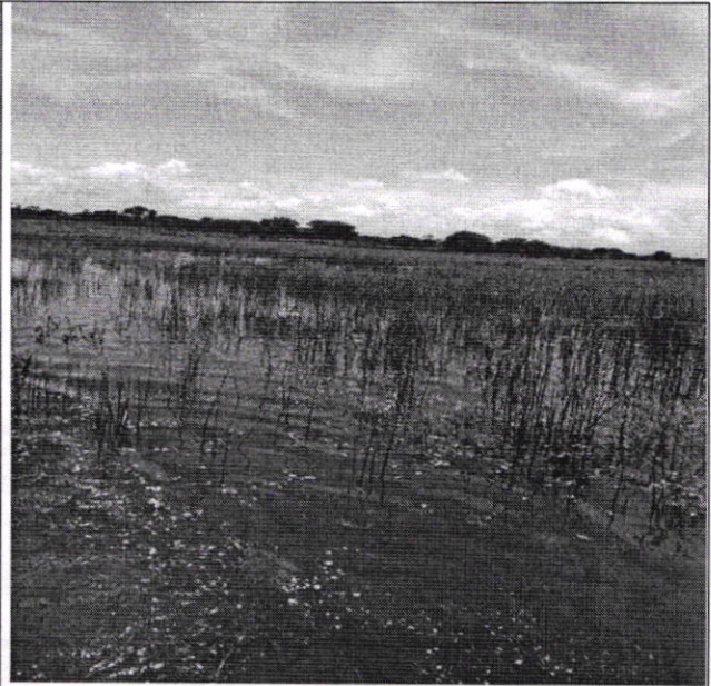
Figura 4. Se evidencia represamiento por taponamiento.