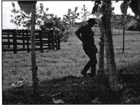
Figura No. 1. Vista general del área donde se encuentran las construcciones (Casas y Corral) reconstruidas presuntamente con los productos aprovechados en la Finca Nueva Vida y/o Acuapez ubicada en el KM 3 vía que de Tierralta conduce a la región de Quebrada Honda. Municipio de Tierralta - Córdoba.