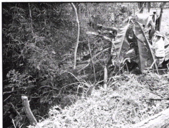
Figura No. 3. Árboles talados a la orilla de la Quebrada Honda, donde se observa el material restante de la Tala realizada en la en la Finca Nueva Vida y/o Acuapez ubicada en el KM 3 vía que de Tierralta conduce a la región de Quebrada Honda. Municipio de Tierralta – Córdoba.