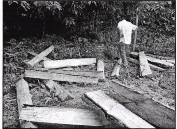
Figura No. 2. Árboles talados de varias especies observándose los (Tocones con rebrotes y restos de los Árboles Talados) realizada en la en la Finca Nueva Vida y/o Acuapez ubicada en el KM 3 vía que de Tierralta conduce a la región de Quebrada Honda. Municipio de Tierralta – Córdoba.