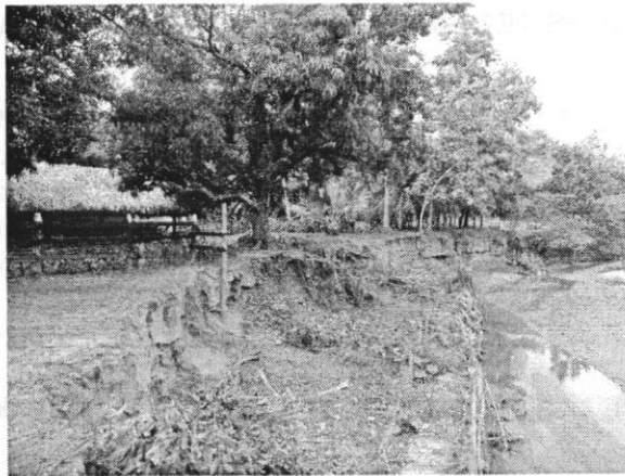
Foto No. 3 – Margen Derecha del Arroyo afectado por procesos erosivos, margen convexa de un meandro