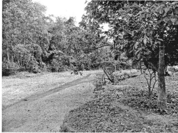
Foto No. 4 – Lecho menor intervenido en labores mineras presuntamente ilegales