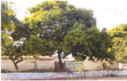
Plaza Roja dos (2) Mangos