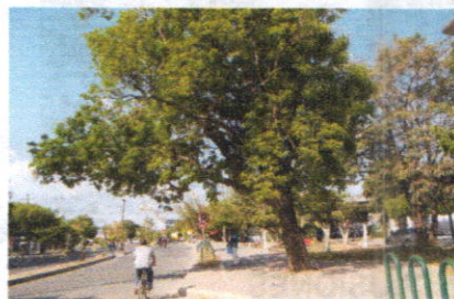
Dg. 9 y 10 Un (1) Roble y un (1) frutal de Mamón