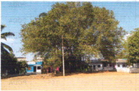
Dg. 6 con 10 un (1) Higo y un (1) Mango