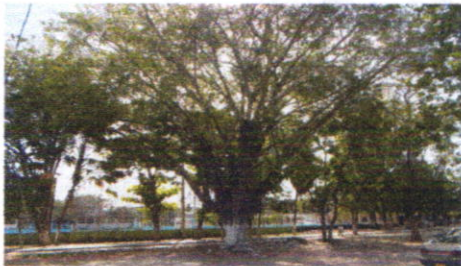
Estadio de Softball Dos (2) Laureles y un (1) Mango