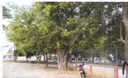
Dgs. 7 a 11 Cinco (5) Almendros y dos (2) Laureles