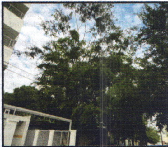
Características del árbol.