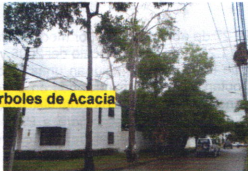
Arboles de Acacia