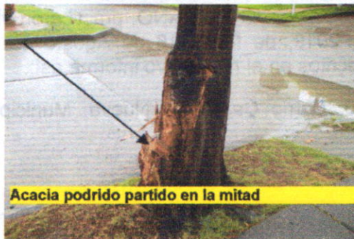
Acacia podrido partido en la mitad