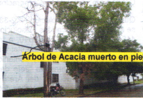
Árbol de Acacia muerto en pie