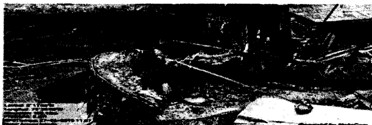
Fotografía 4. Medición de tocones.