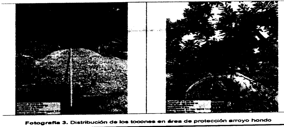
Fotografía 3. Distribución de los tocones en área de protección arroyo hondo

Se encontró un total de cinco (05) tocones de la especie, caracolí ( Anacardium excelsum ).