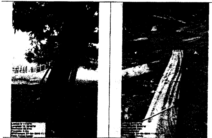
Fotografía 6. Madera en tabla producto del aprovechamiento

El cálculo volumétrico para los tocones de las diferentes especies encontradas en la visita de inspección se basó en alturas comerciales estimadas directamente en campo. De manera que se estimó un total de madera de 7.952 m 3 de madera en bruto.