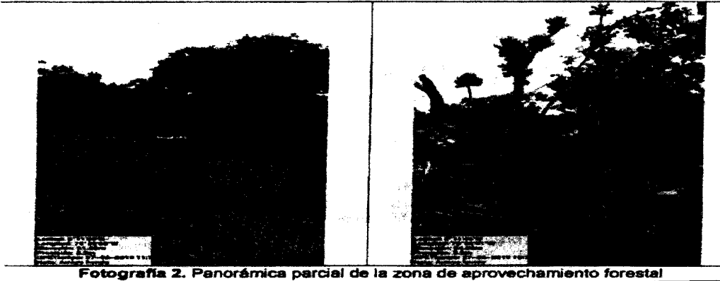
Fotografía 2. Panorámica parcial de la zona de aprovechamiento forestal

Los individuos talados correspondieron a la especie, caracolí ( Anacardium excelsum ), se encontraban en área de protección y conservación del arroyo hondo la distancia entre un individuo y otro según medición directa en campo fue entre 5 m y 10 m aproximadamente entre plantas en conformación de área protectora, los tocones se encontraban dispersos a lo largo del arroyo así como el resto del fuste talado.