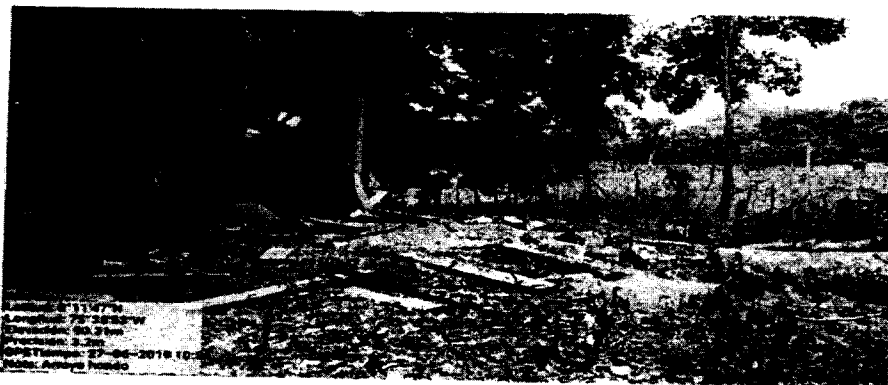
Fotografía 1. Panorámica parcial de la zona de aprovechamiento forestal.