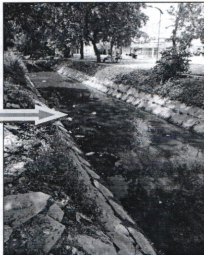
Foto No.4. Canal.

Canal de drenaje de Aguas Lluvias donde realizan el vertimiento