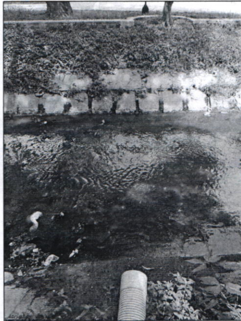
Foto 3. Punto de vertimiento.

Las aguas grises no domesticas producto del lavado de vehículos son vertidas directamente sobre el canal de drenaje de aguas lluvias mediante un tubo de PVC de 4 pulgadas sin ningún tipo de pre-tratamiento en las coordenadas geográficas N 8°43'53.3" - W 75°52'55.4".