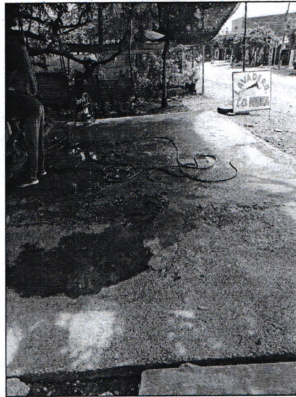
Foto 1. Placa de lavado

El lavadero se encuentra ubicado presuntamente en el espacio público a orillas de un canal de drenaje de aguas lluvias ubicado en la Manzana 15 Lote 11 Barrio Mogambo, en el municipio de Montería – Córdoba. Para la realización de la actividad de lavado, cuenta con una placa en cemento donde se realiza el lavado motocicletas. El punto de lavado se encuentra ubicado a menos de 5 metros de la orilla del canal.